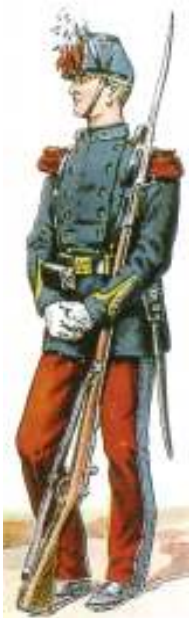
Uniforme porté à Saint-Cyr, de 1870 à 1894.

Dessin de Charles Brun, dans Le centenaire de Saint-Cyr 1808-1908 (Éd. Berger-Levrault, 1908), par un groupe d'officiers.